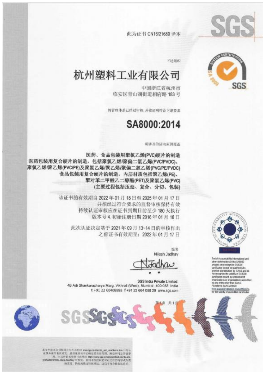
图1 SA8000社会责任管理体系证书

一个企业最大的社会责任，就是要让公司健康发展，为社会创造更多价值。一家成功的公司会解决就业、缴税、员工福利、环境保护等问题，同时为政府纳税，政府税收又会通过多种方式完成相应的社会责任。公司于2016年6月通过ISO22000:2005食品安全管理体系，2016年7月通过并持续运行SA8000：2014社会责任体系。