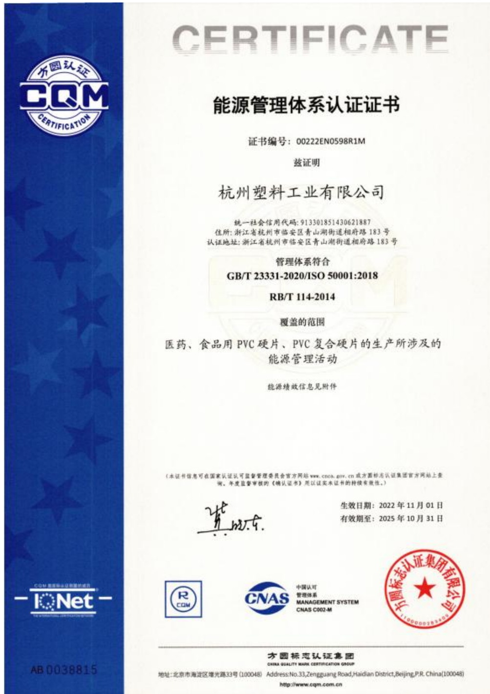
图6-GB/T 23331能源管理体系证书